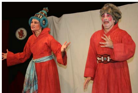
Jocaste et Laïos