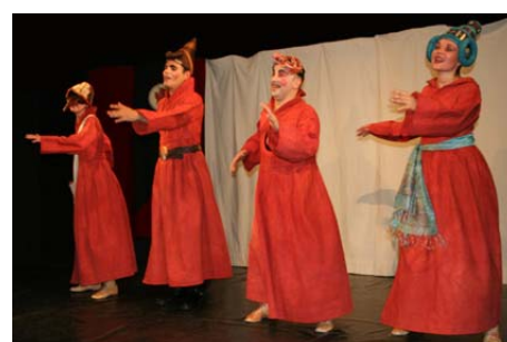
Le final !

Photos de la représentation du 3 juillet 2005 au Théâtre en rond de Fresnes