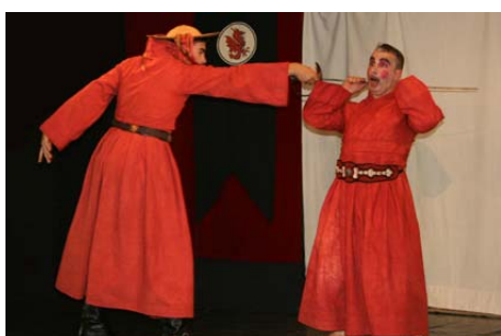
Œdipe tue son père Laïos