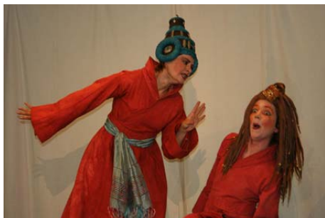
Jocaste chez la Pythie