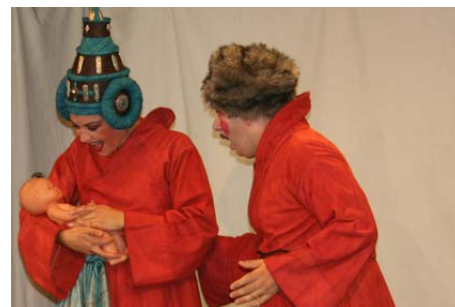
Jocaste et Laïos avec leur enfant