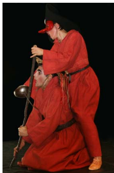
Œdipe et Léonidas