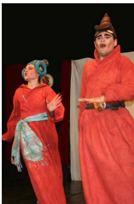
Jocaste et Œdipe