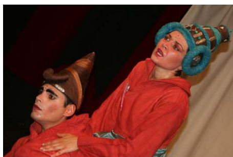
Œdipe et Jocaste